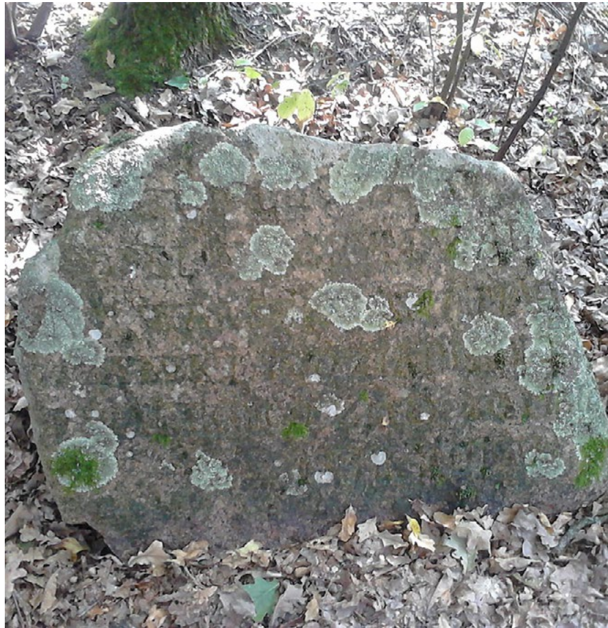
Lebiedziew. Cmentarz tatarski, nagrobek z polską inskrypcją.

W islamie nie ma wyznaczonych dni do odwiedzania zmarłych. Można każdego dnia przyjść i odwiedzić bliskich, by się pomodlić, ewentualnie uporządkować otoczenie grobu.