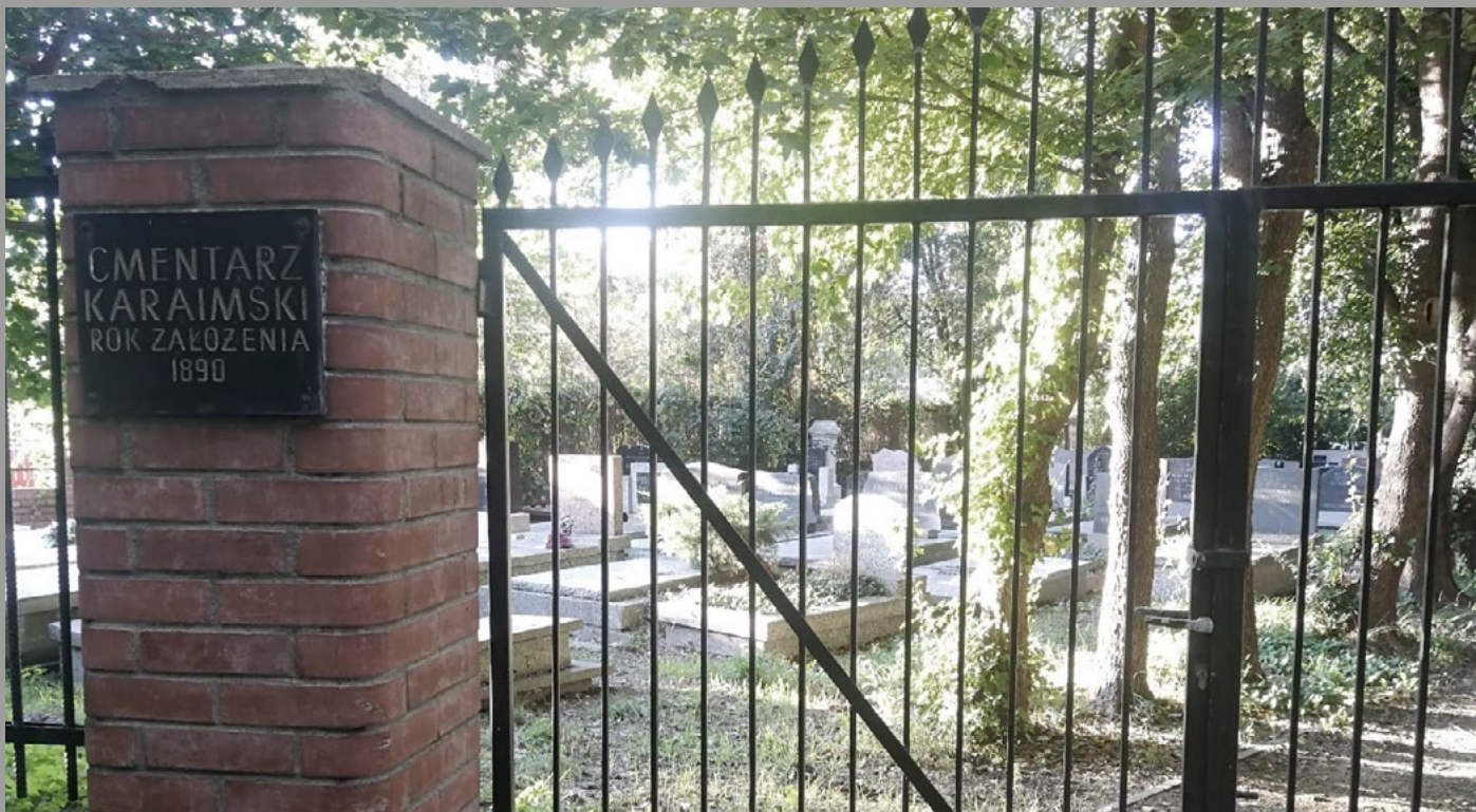
Brama cmentarza karaimskiego w Warszawie