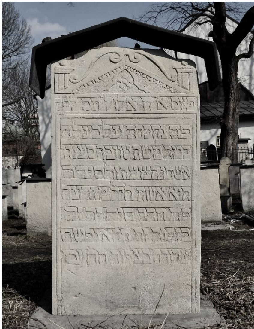
Cmentarz żydowski Remu w Krakowie

Podczas pobytu na cmentarzu mężczyźni muszą nosić nakrycie głowy. Oznaką oddania szacunku zmarłemu jest położenie na grobie kamyka. W ostatnich dekadach coraz częściej na nagrobkach widuje się kwiaty i znicze, nie jest to jednak tradycyjny zwyczaj żydowski.