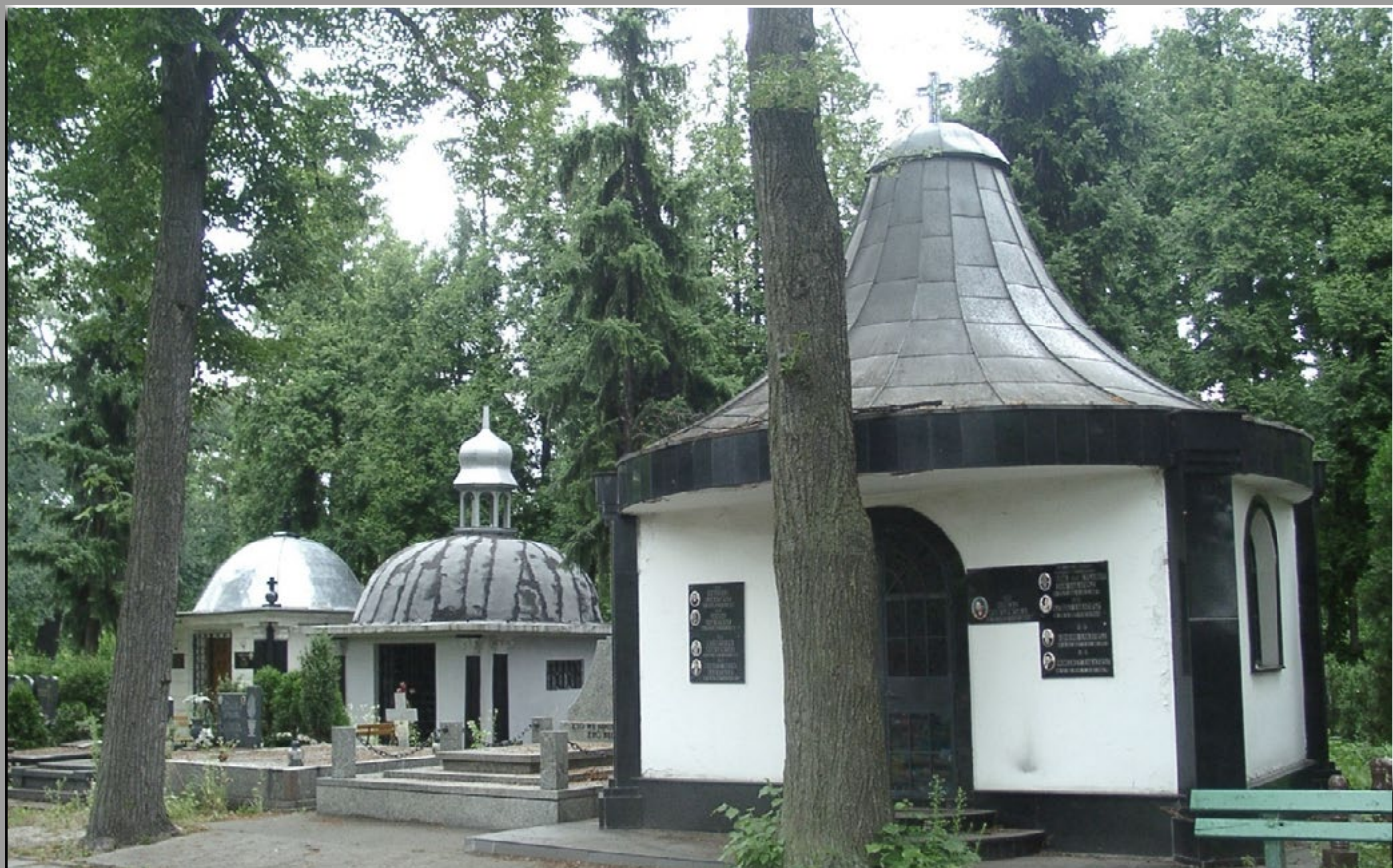
Cmentarz Komunalny we Wrocławiu przy ul. Osobowickiej.