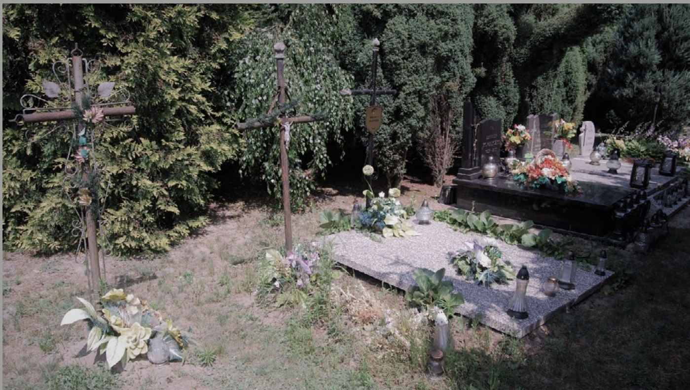
Cmentarz mariawitów w Zdunach koło Łowicza