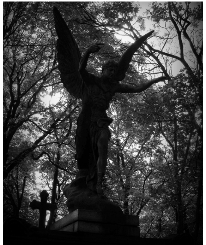
Cmentarz na Powązkach w Warszawie

Żałoba według tradycji trwała przeważnie rok. Dziś coraz więcej osób traktuje te wymogi bardzo indywidualnie. Coraz mniej osób, nawet tych z najbliższej rodziny, nosi czarny lub ciemny strój przez jakiś czas po pogrzebie. W rocznice śmierci zamawia się mszę za zmarłego.