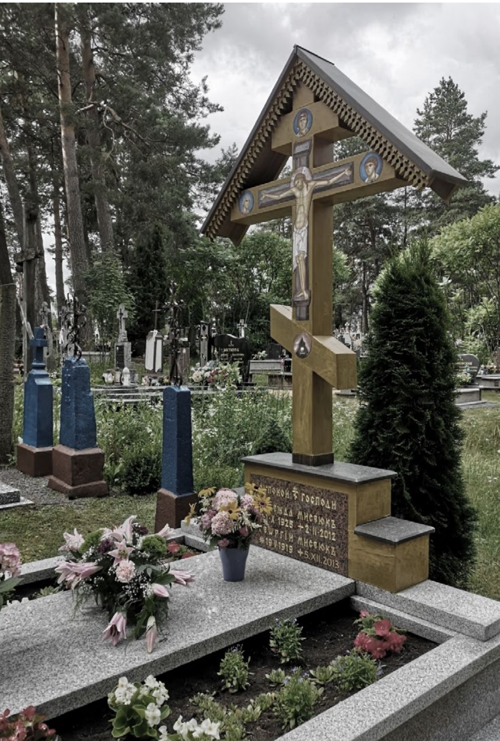
Cmentarz prawosławny parafii Czyże w powiecie hajnowskim

Pierwsi chrześcijanie zbierali się na nabożeństwa w katakumbach, gdzie Boską Liturgię sprawowali na grobach męczenników. Wspominali wówczas tych, dzięki którym żyli. My postępujemy podobnie. Odwiedzamy groby naszych bliskich, modlimy się za spokój ich dusz zapalamy lampki oliwne, świece bądź znicze.