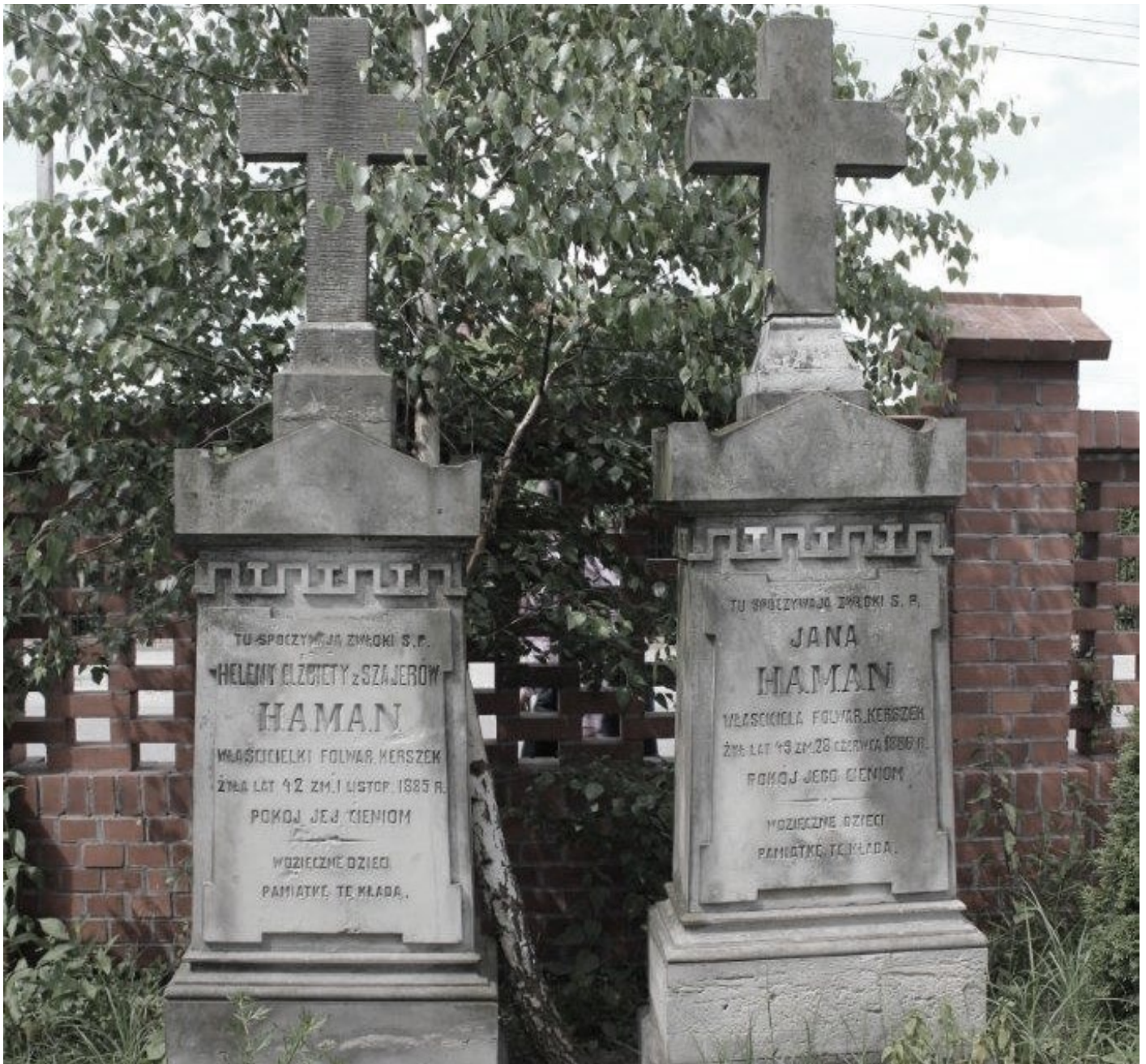
Cmentarz ewangelicko-augsburski w Nowej Iwicznej