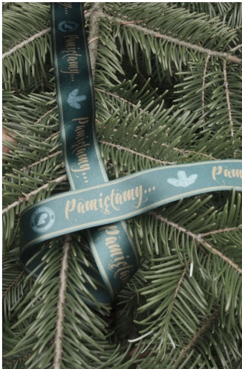
Gałązka jedliny od leśników - na cmentarzu z czasów I wojny światowej

Również kwestia przybierania grobów, zwłaszcza na Wszystkich Świętych, wymaga rozważenia. Często na pojedynczej mogile widać kilka czy nawet kilkanaście doniczek żywych chryzantem pomieszanych ze sztucznymi bukietami, których do wiosny nie ma kto uprzętnąć. Marny to i krótkotrwały dowód pamięci o zmarłych, a poza tym takie ozdoby grobów trudno później segregować, więc w efekcie trafiają na wysypiska jako odpady „zmieszane”.