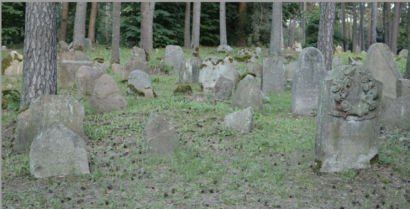
Mizar w Kruszynianach. Miejsce pochówku od 350 lat